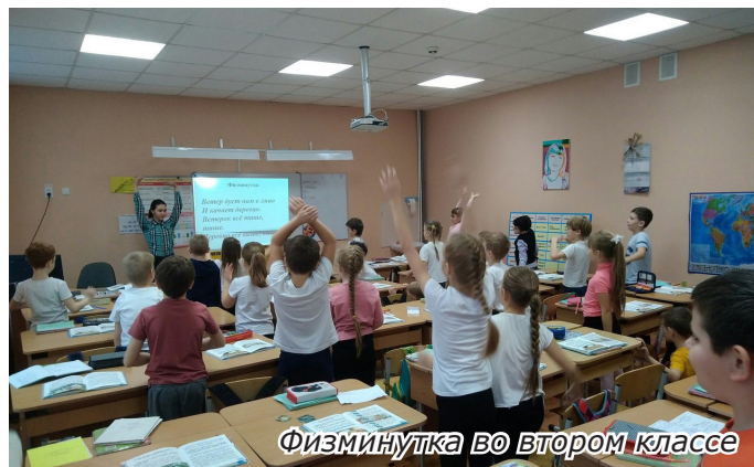
Физминутка во втором классе