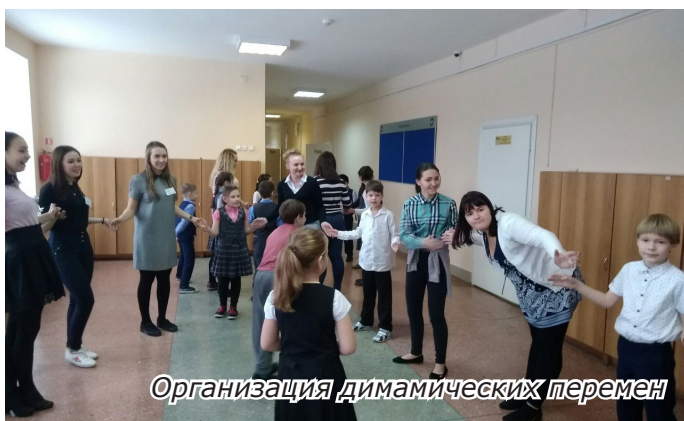
Организация динамических перемен